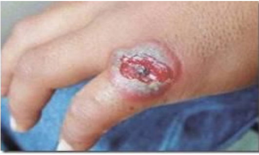
Deride habis çıban yada deri karbonkülü

Akciğer şarbonu; özellikle hayvan yünleri ve kıllarıyla uğraşanların sporları solumasiyla meydana gelmektedir. Ağır bir hemorajik bronko-pnömoni ile karakterizedir.