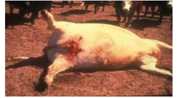
Şarbondan ölen hayvandan ağız ve bağırsaklardan kan gelir. Bu kan pıhtılaşmaz.

Ölen hayvanların, ağız- burun ve anüsünde kan izleri veya kanlı bir sızıntı bulunur. Kesilen hayvanların kanı siyah renktedir ve pıhtılaşmaz. İnsanlar hasta hayvanları kesip yüzmek, etini yemek veya bu hayvanların deri ve yünlerini işlemek suretiyle hastalığa yakalanırlar.